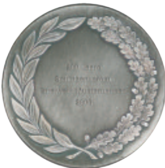
Gravierte Rückseite Maßstab: 1 : 2