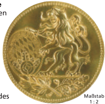
Maßstab 1 : 2

Anträge zur Verleihung sind zu Beginn des Jubiläumsjahres über den zuständigen Bezirk schriftlich in der Geschäftsstelle des BSSB einzureichen.