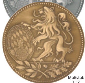
Maßstab 1 : 2